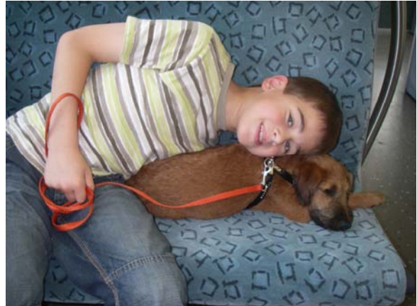
S-Bahn-Fahren macht Spaß