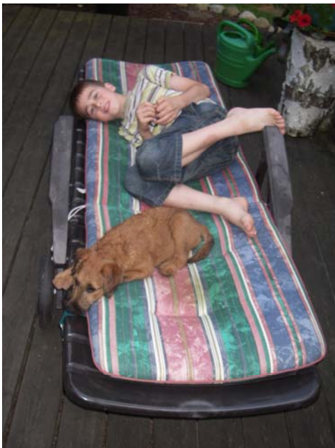
Friede, Freude, Eierkuchen