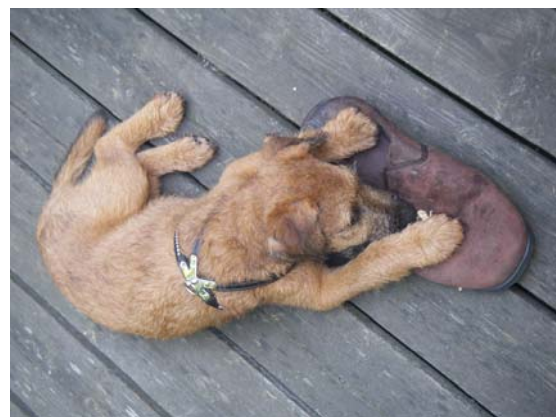
Opas Schuhe sind die Besten.