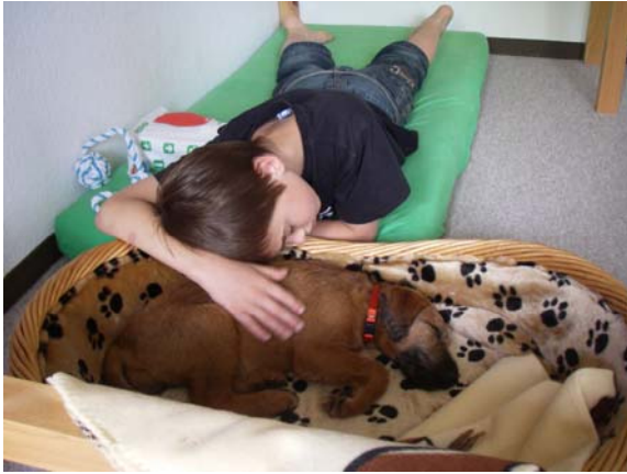
zwei müde Krieger